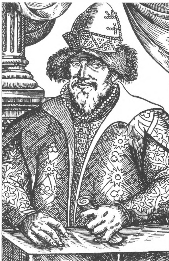
Иван IV Портрет. XVII в.

мышления в России к середине XVI века. Возражение вызывает то, что Золотухина переносит представления XX века на события далекого прошлого, а сам уровень «политико-юридического мышления» в России середины XVI века едва ли может быть определен с достаточной степенью точности, чтобы рассуждать о том, что является шагом назад, а что — шагом вперед*.