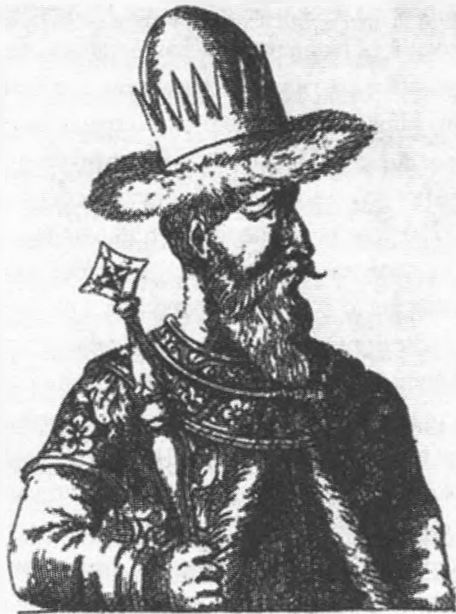
IOHANNES BASILIDES MAGNUS MOSCOVITA RUM DUX.